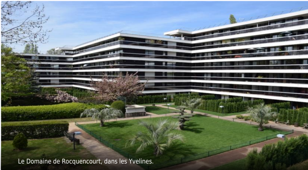
Le Domaine de Rocquencourt, dans les Yvelines.

Publié le 2 mars 2022 à 16:39, mis à jour le 8 mars 2022 à 19:03 - 2 conseils